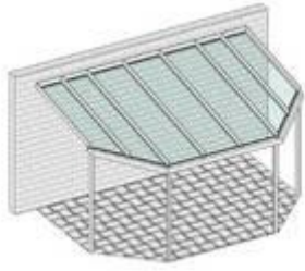
Pulldach mit abgeschrägten Rinnenecken