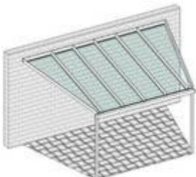
Pulldach mit abgeschrägten Seiten