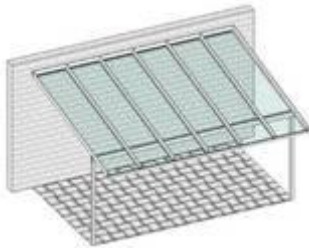
Pulldach mit Dachüberstand