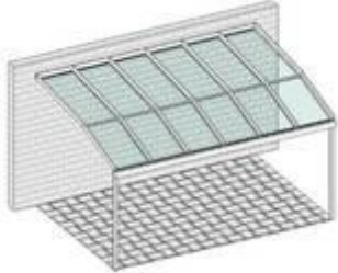
Pulldach mit Solarknick