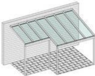
Pulldach mit unterschiedlichen Bautiefen